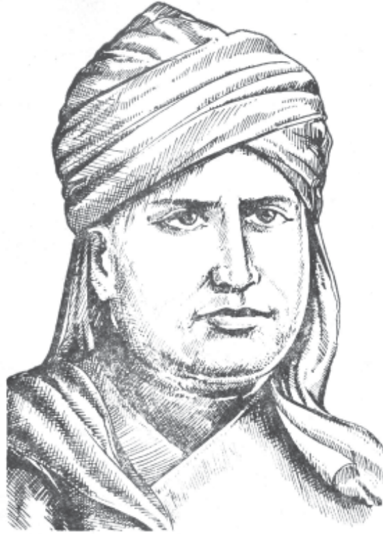
—Swami Dayanand Saraswati