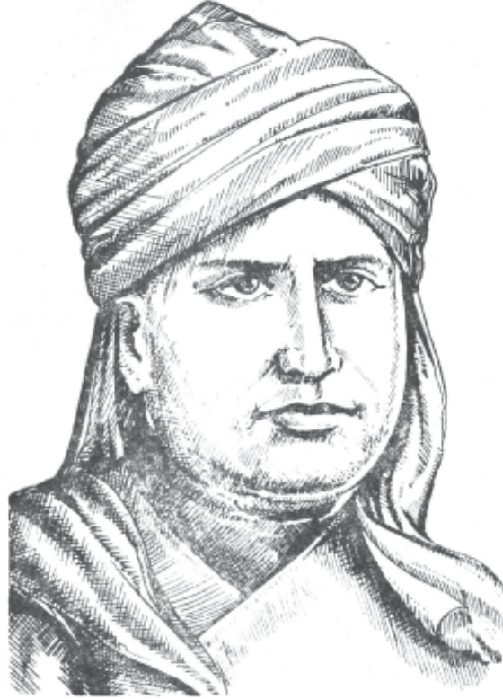
—Swami Dayanand Saraswati மகரிஷி தயானந்த சரஸ்வதி